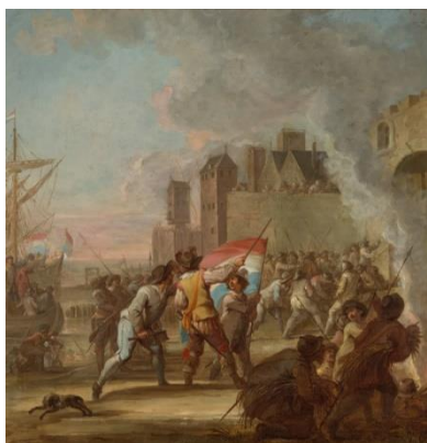
Watergeuzen nemen Den Briel in 1 april 1572